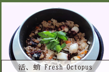
活、蛸 Fresh Octopus