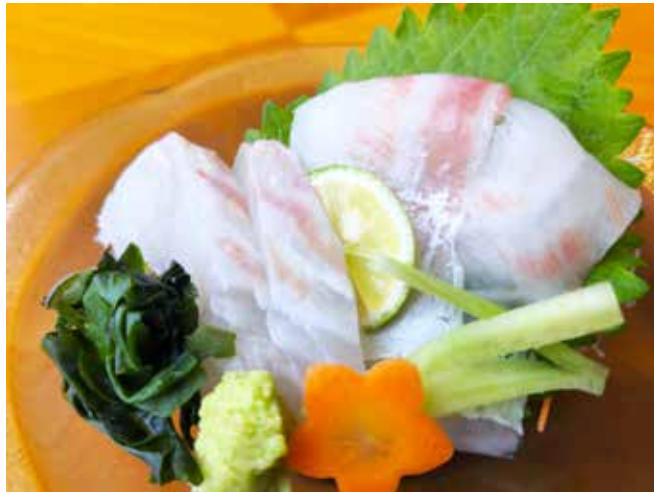
本日の鮮魚の造り単品 Today's Sashimi 800