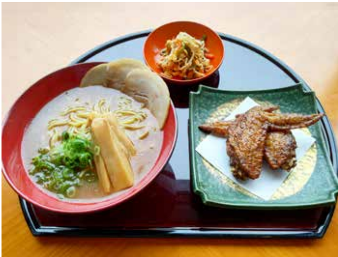
豚骨醤油ラーメンセット Pork Bone Soya Sauce Ramen Set (Includes Appetizer and Deep Fried Chicken Wings) 2,000