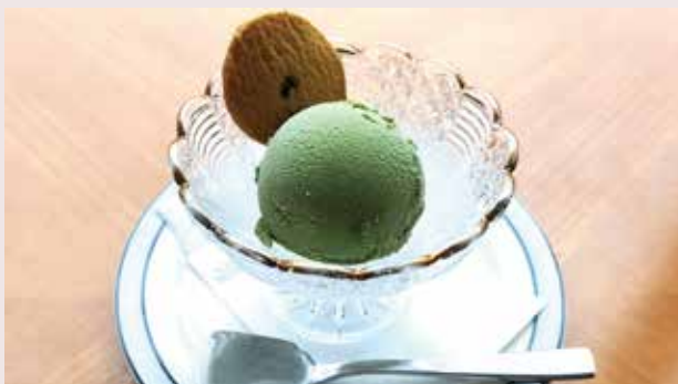
抹茶アイスクリーム Matcha Green Tea Ice Cream 500