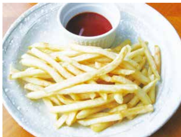
フライドポテト French Fries 800