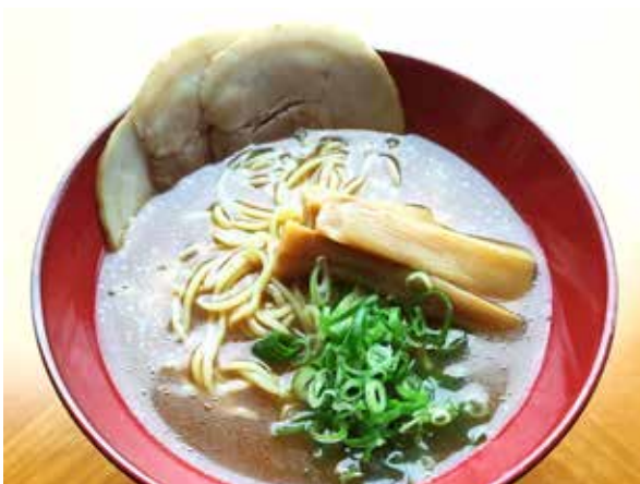
豚骨醤油ラーメン Pork Bone Soya Sauce Ramen 1,200