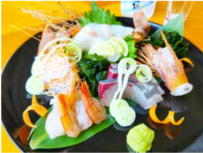
本日の鮮魚の 造り盛り合わせ(三種) Today's Sashimi Platter (3 Kinds)