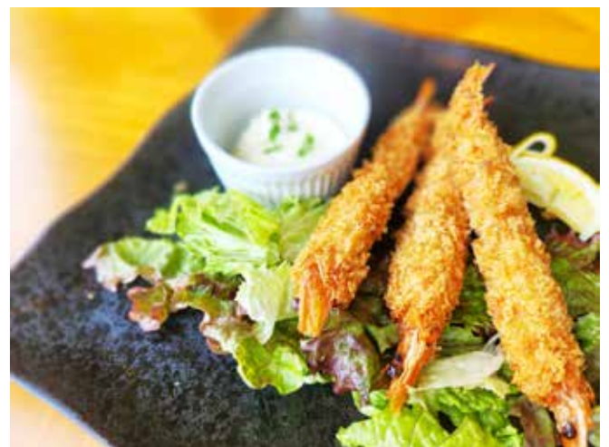
有頭エビフライ(3本) Deep Fried Shrimp(3 Pieces) 1,800