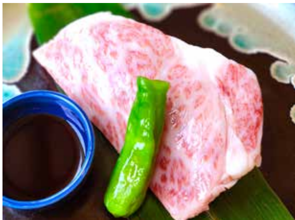
黒毛和牛ステーキ (100g)