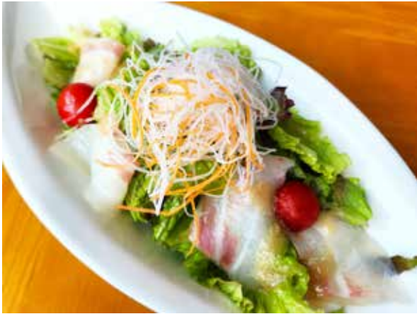
真鯛のカルパッチョサラダ Sea Bream Carpaccio Salad 1,400