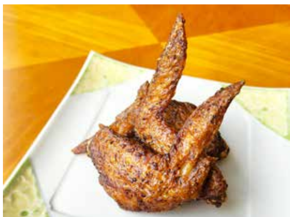
手羽黄金揚げ(3本) Deep Fried Chicken Wings(3 pcs) 900