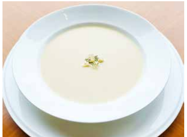
ポタージュスープ Potage Soup 800