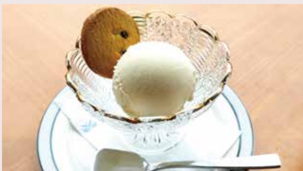
バニラアイスクリーム Vanilla Ice Cream 500