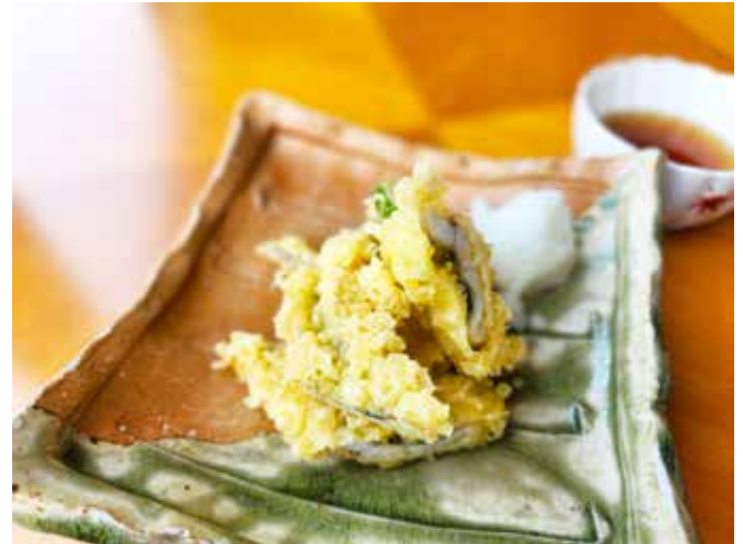
泉州地穴子天婦羅 Local Wild Eel Tempura 1,800