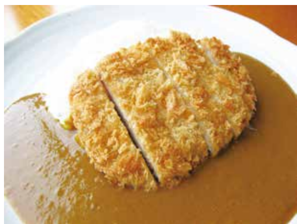
カツカレー Fried Pork Culet Curry Rice 2,000