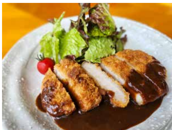
三元豚トンカツ Sangenton Pork Cutlet 1,800