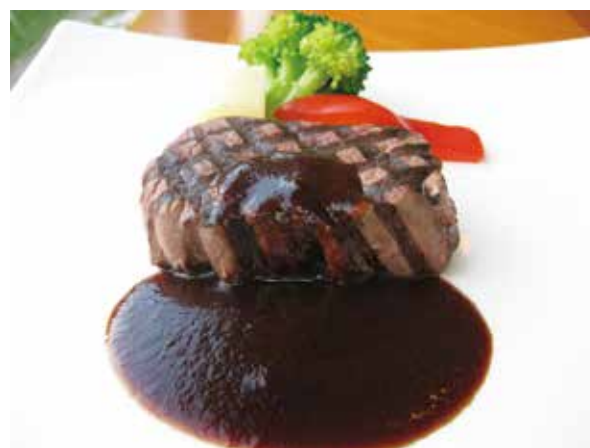
牛フィレステーキ(120g) Beef Fillet Steak 3,000