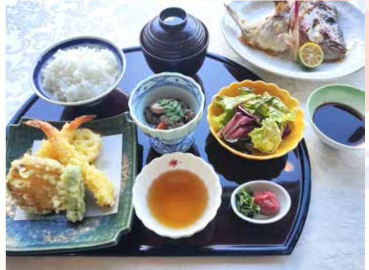
海老と野菜の天婦羅のチョイス Choice of Shrimp & Vegetables Tempura

真鯛の兜焼き 海老と野菜の天婦羅又は造り盛り合わせ ミニサラダ 御飯 汁 香の物 珈琲 / 紅茶 / オレンジジュース / アップルジュース Grilled Red Sea Bream Fish Head, Shrimp & Vegetables Tempura OR Sashimi Assortment, Mini Salad, Rice, Soup, Pickles, Coffee/English Tea/Orange Juice/Apple Juice