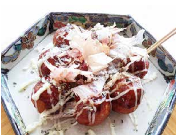
たこ焼き Takoyaki Octopus Balls