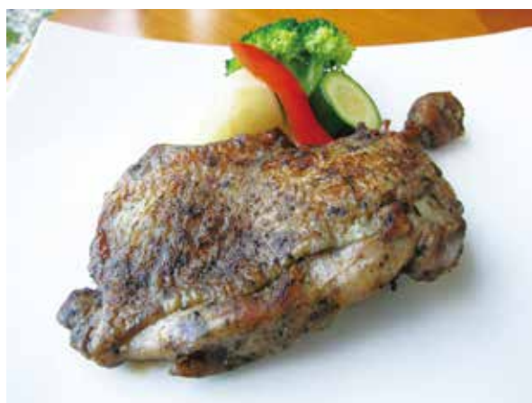
ローストチキン Roasted Chicken 1,800