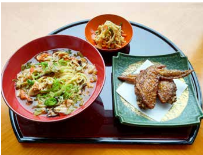
酸辣湯麺セット Hot and Sour Noodles Set (Includes Appetizer and Deep Fried Chicken Wings) 2,000