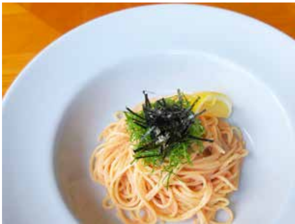
たらこスパゲティー Tarako Fish Roe Spagetthi 1,400