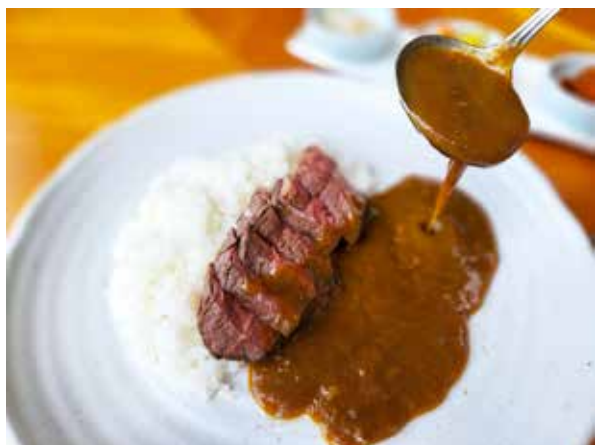
ビーフステーキカレー Beef Steak Curry Rice