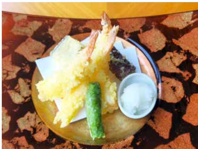
海老と野菜の天婦羅盛り合わせ Shrimp and Vegetable Tempura Platter 1,600