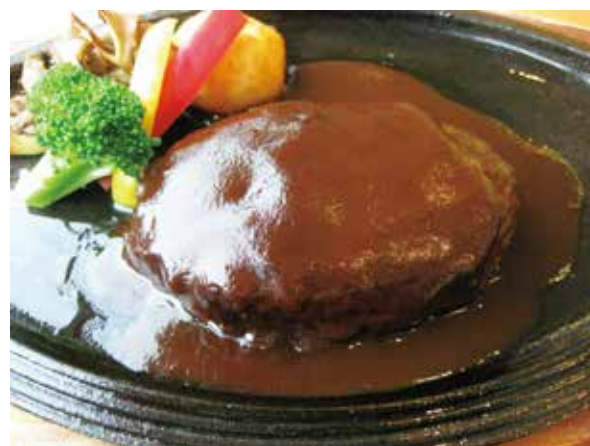
自家製和牛ハンバーグ Homemade Wagyu Beef Hamburger Steak 2,200

● パン、サラダ、スープセット Set of Bread, Salad & Soup 650