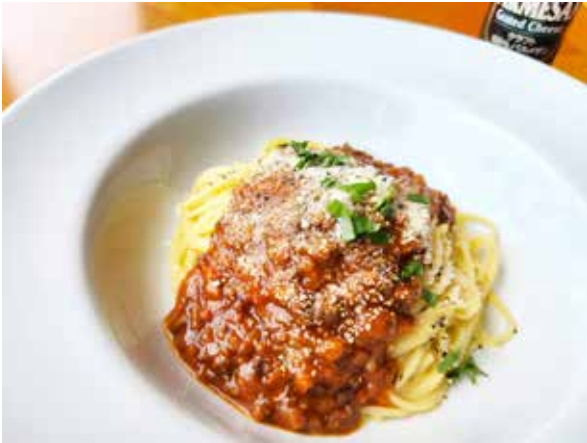
黒毛和牛100%ミートスパゲティー 100% Black Wagyu Meat Spagetthi 1,800