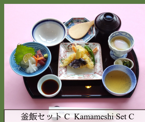
釜飯セット C Kamameshi Set C

1 Kamameshi Pot Rice, Tempura, Sashimi, Side Dish, Soup, Pickles, Coffee