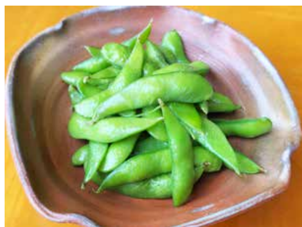
茹でたて枝豆 Boiled Edamame Beans 450