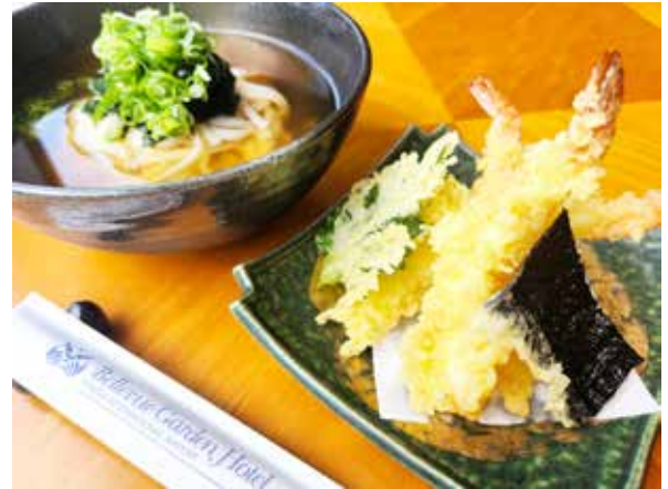
天婦羅うどん Tempura Udon 1,800