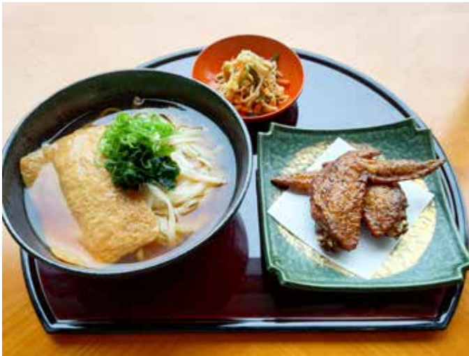
きつねうどんセット Deep Fried Tofu Udon Set (Includes Appetizer and Deep Fried Chicken Wings) 2,000