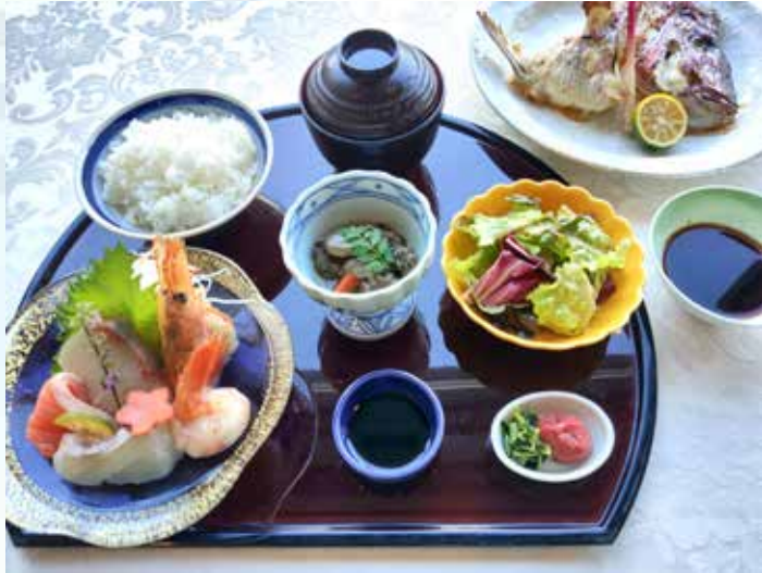
造り盛り合わせのチョイス Choice of Sashimi Assortment