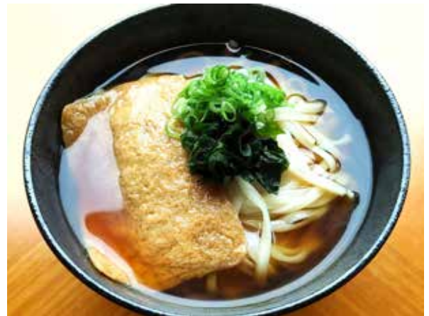
きつねうどん Deep Fried Tofu Udon 1,200