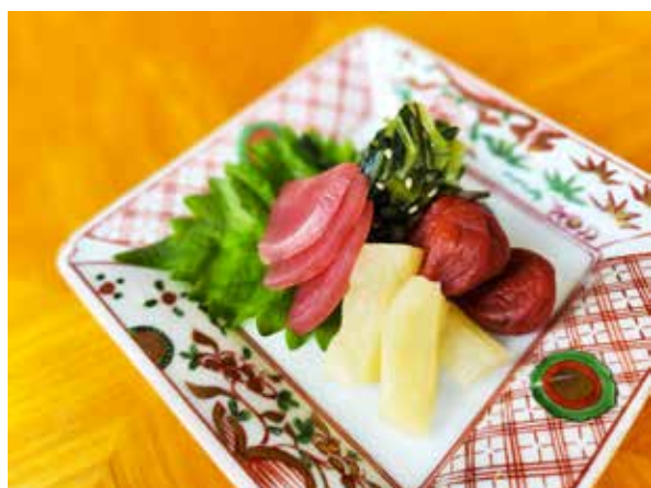
香の物盛り合わせ Pickles Assortment 450