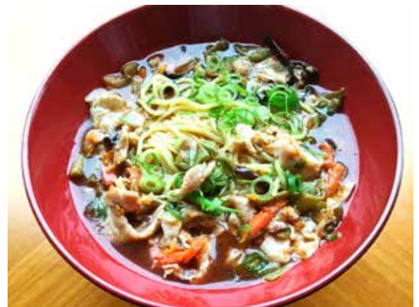
酸辣湯麺 Hot and Sour Noodles 1,200