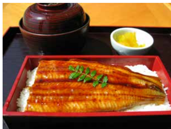
鰻重(香の物、汁付き) Grilled Eel Rice w/ Pickles & Soup 2,500