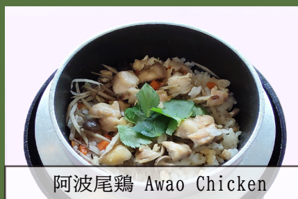
阿波尾鶏 Awao Chicken