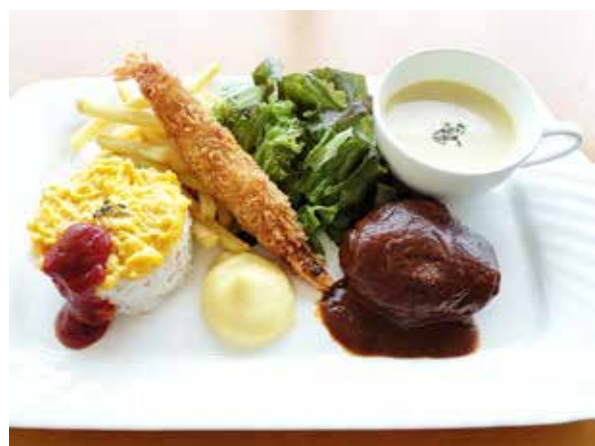
お子様セット ※12歳未満のお子様限定 (和牛ハンバーグ、エビフライ、オムライス、 フライドポテト、スープ、サラダ、アイスクリーム) Children's Set *For kids below 12 years old (Wagyu Hamburger Steak, Fried Shrimp, Omelet Rice, French Fries, Soup, Salad, Ice Cream)