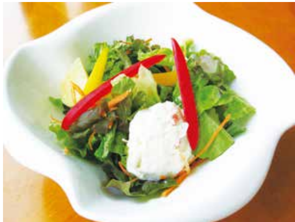
季節のサラダ Seasonal Salad 800