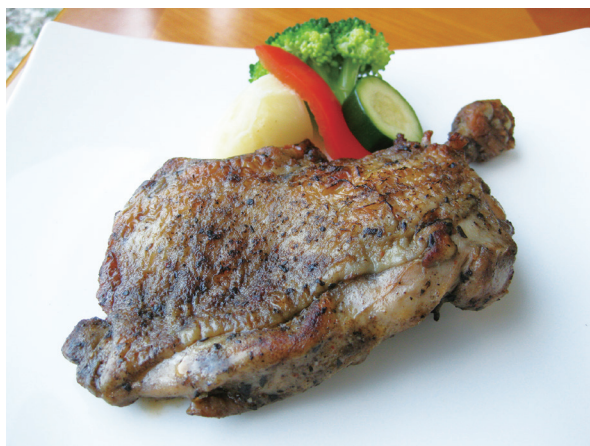
ローストチキン 로스트 치킨 1,800