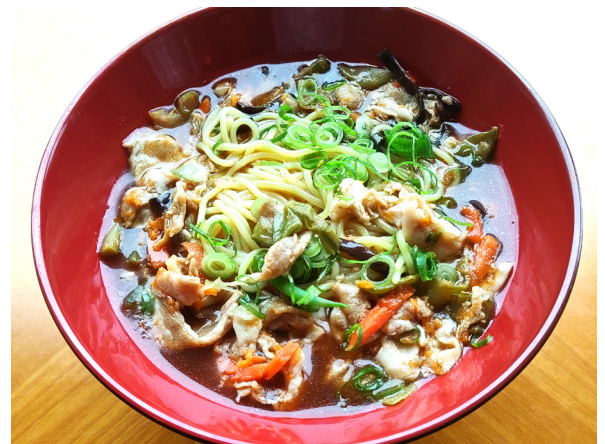
酸辣湯麵 산랏탕면 세트 1,200

* 価格には消費税、サービス料が含まれております。 가격에는 소비세의 봉사료가 포함되어 있습니다. * 画像はイメージです。 상기 이미지는 연출된 것으로 실제와 다를 수 있습니다..