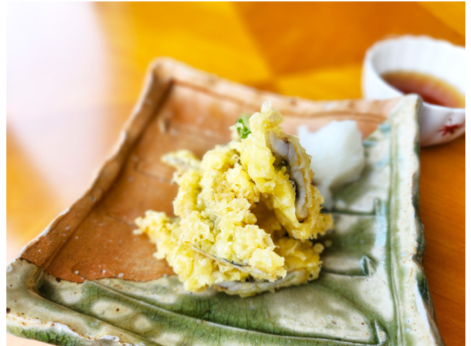
泉州地穴子天婦羅 센슈산(현지산) 바다장어 튀김(덴푸라) 1,800