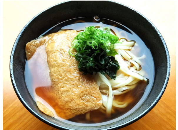
きつねうどん 키츠네 우동 (유부 우동) 1,200