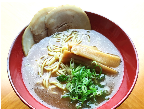
豚骨醤油ラーメン 돈코츠 쇼유(사골 간장) 라멘 1,200