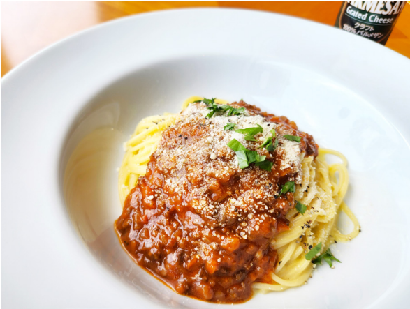
黒毛和牛100%ミートスパゲティー 구로게와규 100% 미트 스파게티 1,800