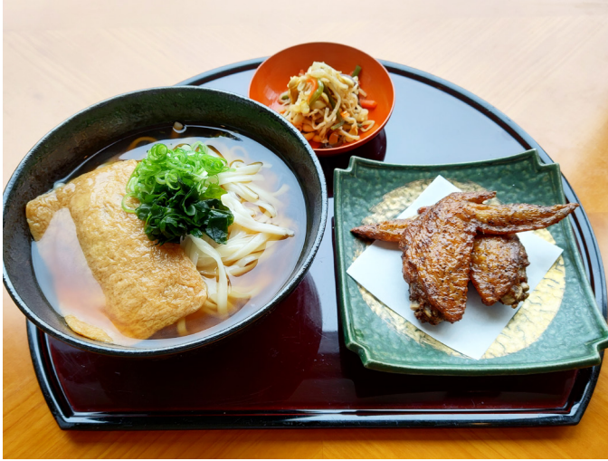
きつねうどんセット 키즈네 우동 세트