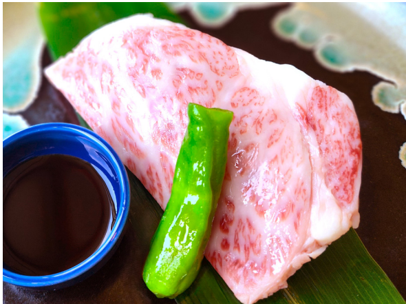
黒毛和牛ステーキ (100g) 구로게와규(흑우) 스테이크