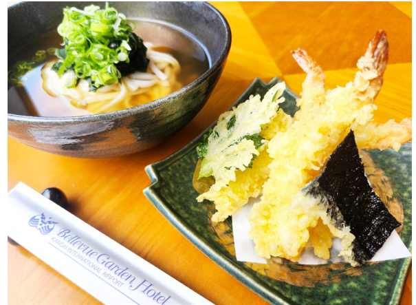
天婦羅うどん 튀김(덴푸라) 우동 1,800