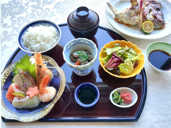
造り盛り合わせのチョイス 모듬 사시미 선택