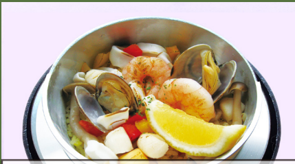
パエリア風 파에야 스타일