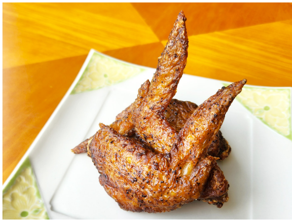
手羽黄金揚げ(3本) 닭날개 황금 튀김 (3조각) 900