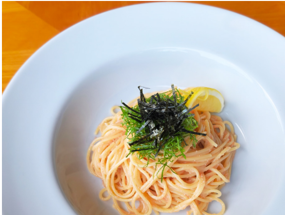
たらこスパゲティー 명란 스파게티 1,400