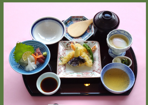
釜飯セット C 솔밥 세트 C

솔밥 1종, 튀김(텐푸라), 사시미, 소소한 요리(고바치), 국, 장아찌, 커피, 장아찌, 커피/홍차/오렌지 주스/사과 주스