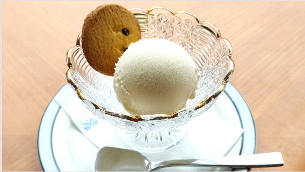
バニラアイスクリーム 바닐라 아이스크림 500