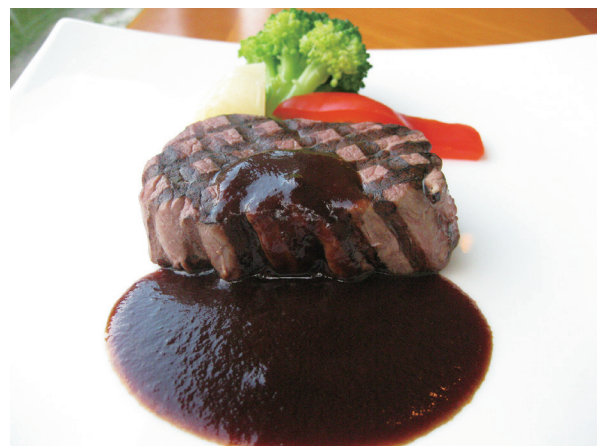
牛フィレステーキ(120g) 소고기 안심 스테이크 3,000