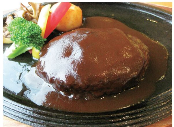
自家製和牛ハンバーグ 수제 와규 함박 스테이크 2,200