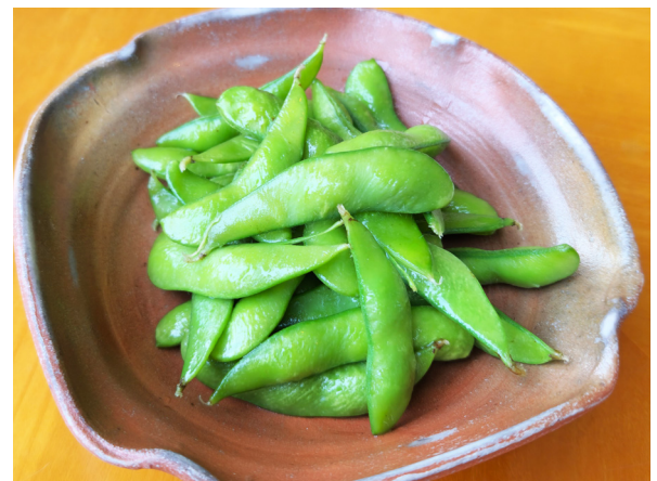
茹でたて枝豆 갓 삶은 풋콩(에다마메) 450