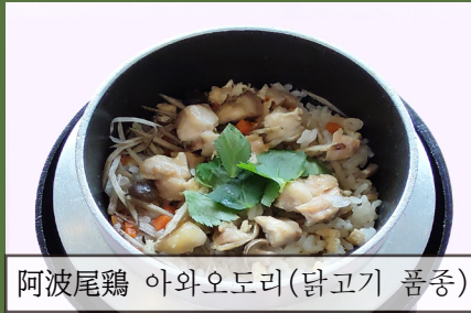
阿波尾鶏 아와오도리(닭고기 품종)