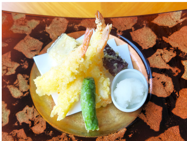
海老と野菜の天婦羅盛り合わせ 새우와 채소 튀김 모듬 1,600