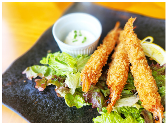
有頭エビフライ(3本) 머리 달린 새우 튀김 (3마리) 1,800