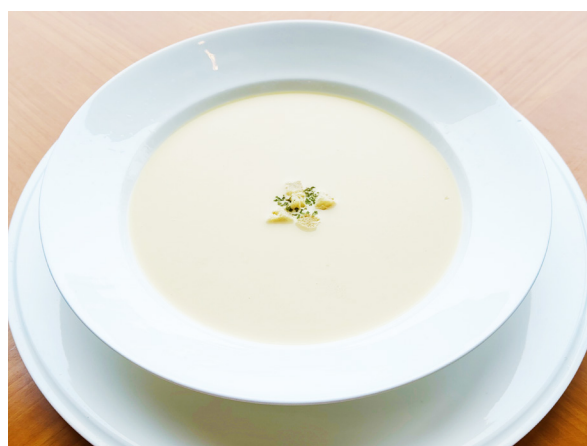
ポタージュスープ 포타주 수프 (걸쭉한 크림 수프) 800

* 価格には消費税、サービス料が含まれております。各々には消費税と 봉사료가 포함되어 있습니다.