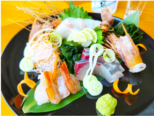
本日の鮮魚の 造り盛り合わせ(三種) 오늘의 제철 생선회(사시미) 모듬 (3종)