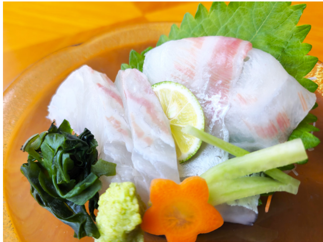
本日の鮮魚の造り単品 오늘의 제철 생선회 단품 800