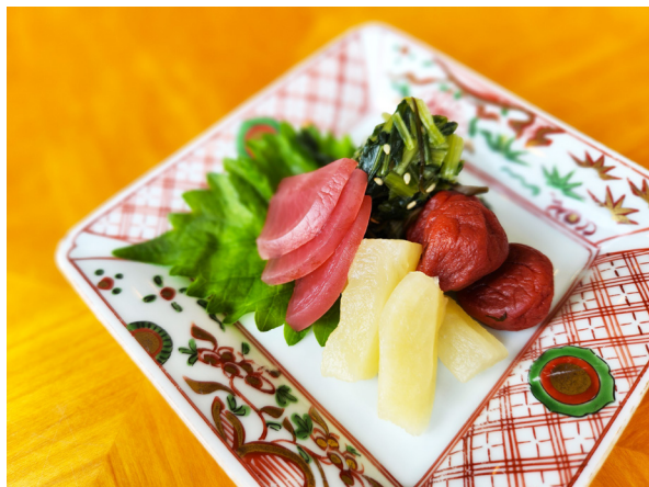
香の物盛り合わせ 일본식 장아찌(츠케모노) 모듬 450