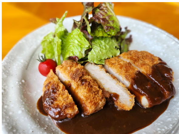
三元豚トンカツ 산젠돈(삼원돈) 돈카츠 1,800