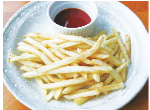
フライドポテト 감자 튀김 800