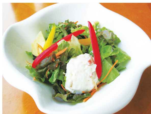
季節のサラダ 계절 샐러드 800