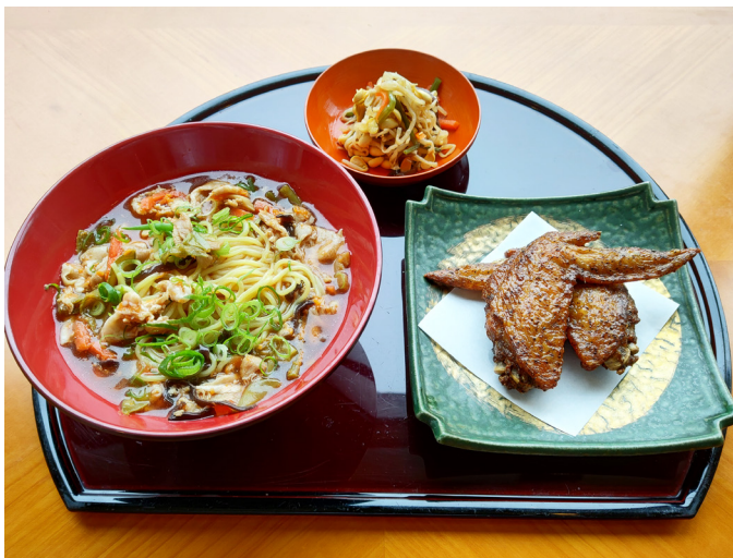
酸辣湯麵セット 산랏탕면 세트