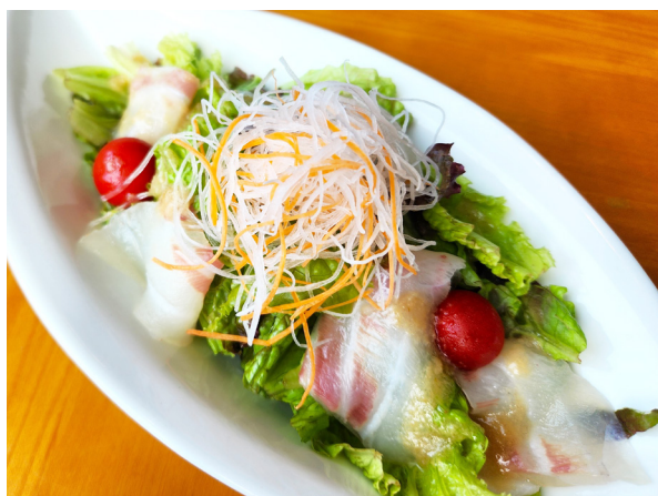
真鯛のカルパッチョサラダ 참돔 카르파초 샐러드 1,400