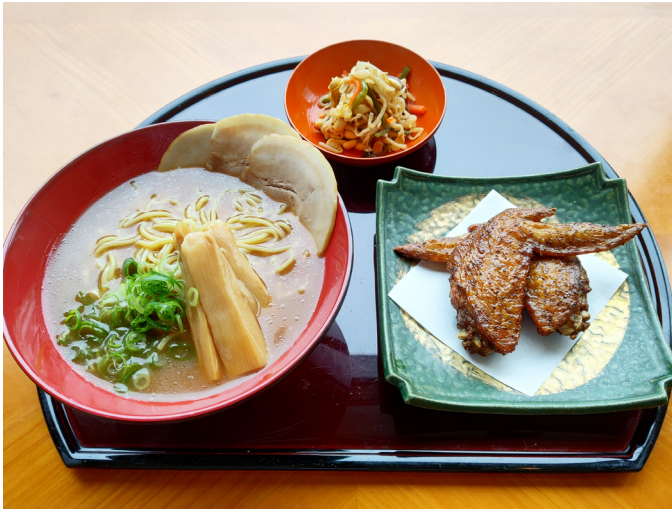
豚骨醤油ラーメンセット 돈코츠 쇼유 라멘 세트