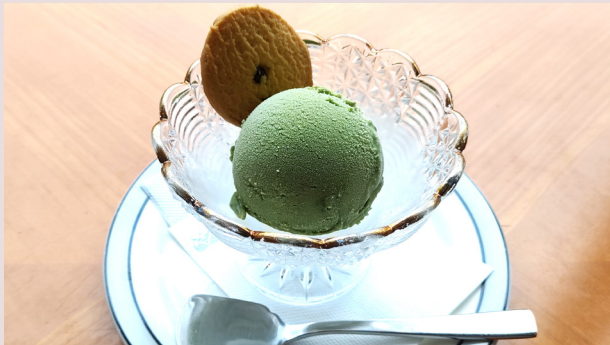
抹茶アイスクリーム 말차 아이스크림 500

* 価格には消費税、サービス料が含まれております。가격에는 소비세와 봉사료가 포함되어 있습니다. * 画像はイメージです。상기 이미지는 연출된 것으로 실제와 다를 수 있습니다.