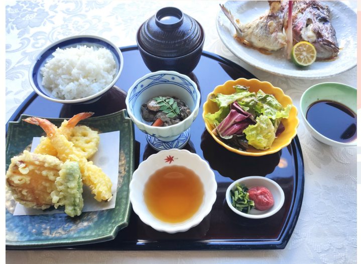
海老と野菜の天婦羅のチョイス 새우와 채소 튀김 선택

真鯛の兜焼き 海老と野菜の天婦羅又は造り盛り合わせ ミニサラダ 御飯 汁 香の物 珈琲 / 紅茶 / オレンジジュース / アップルジュース 참돔 머리구이, 새우와 채소 튀김(텐푸라) 또는 모듬 사시미, 미니 샐러드, 밥, 국, 일본식 장아찌(츠크모노), 커피/홍차/오렌지 주스/사과 주스